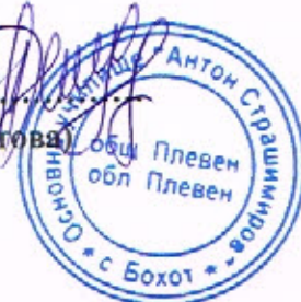
ГРАФИК ЗА ПРОВЕЖДАНЕ НА ИЗПИТИ